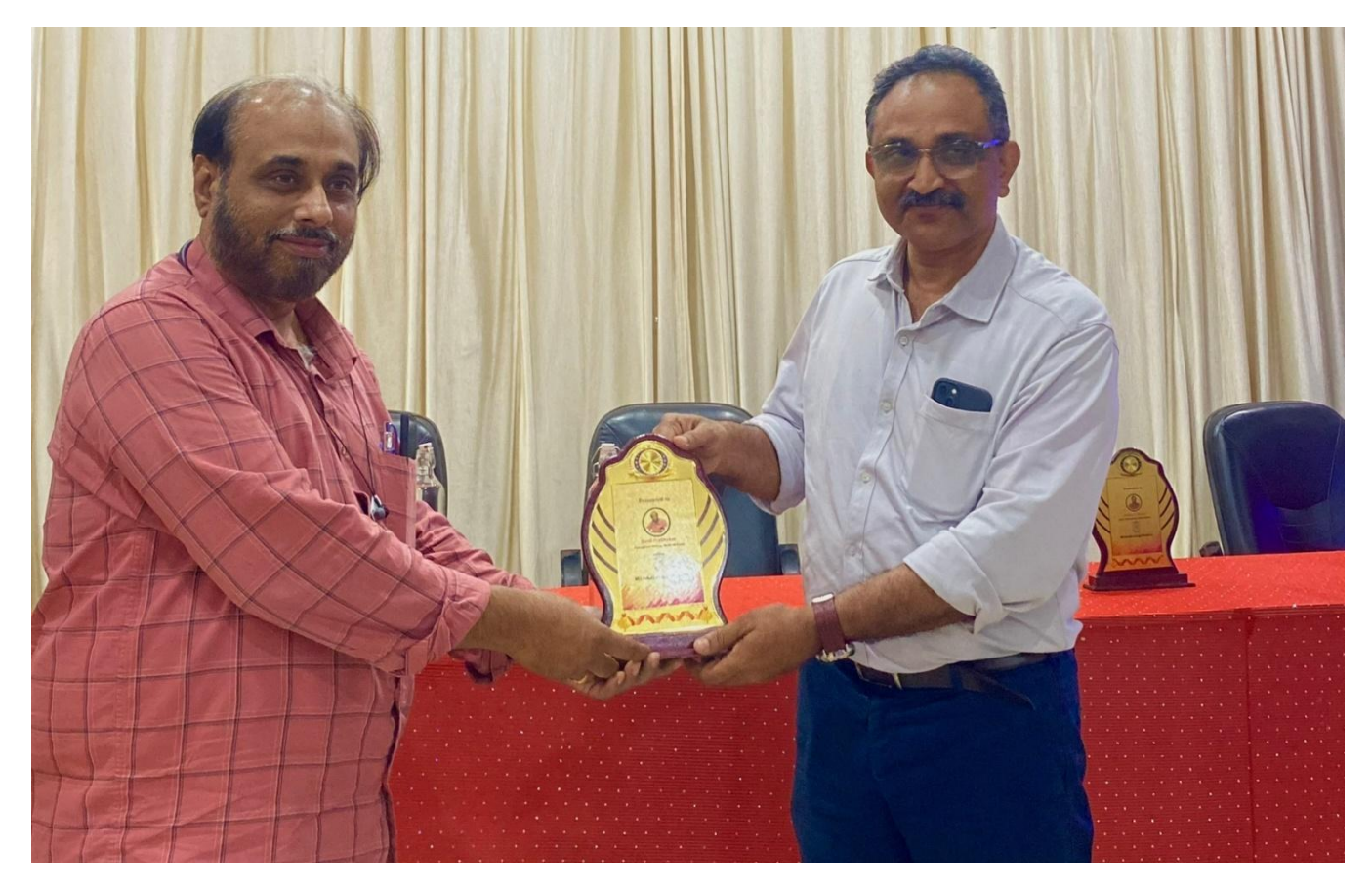
Participant's Profile: 51 Students from first and fourth semester B.Voc digital film production

Workshop on " One Day Smart Phone Film Making " organised by B.Voc Digital Film Production