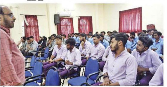
മാത്രഭൂമി മീഡിയ സ്റ്റൂളിന്റെ വിജ്ഞാനവ്യാപന പ്രവർത്തനത്തിന്റെ ഭാഗമായി കൊടുങ്ങല്ലൂർ എം.ഇ.എസ്. അസ്ലാബി കോളേജിൽ നടത്തിയ മൊബൈൽ സിനിമാനിർമാണ ശില്പശാല