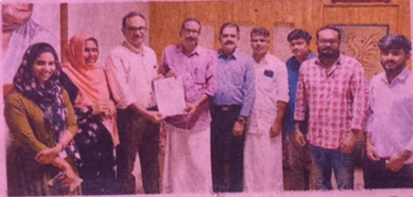
ശ്രീനാരായണപുരം പഞ്ചായത്തും പി. വെമ്പല്ലൂർ എം.ഇ.എസ് അസ്മാബി കോളജും ധാരണപത്രം കൈമാറുന്നു